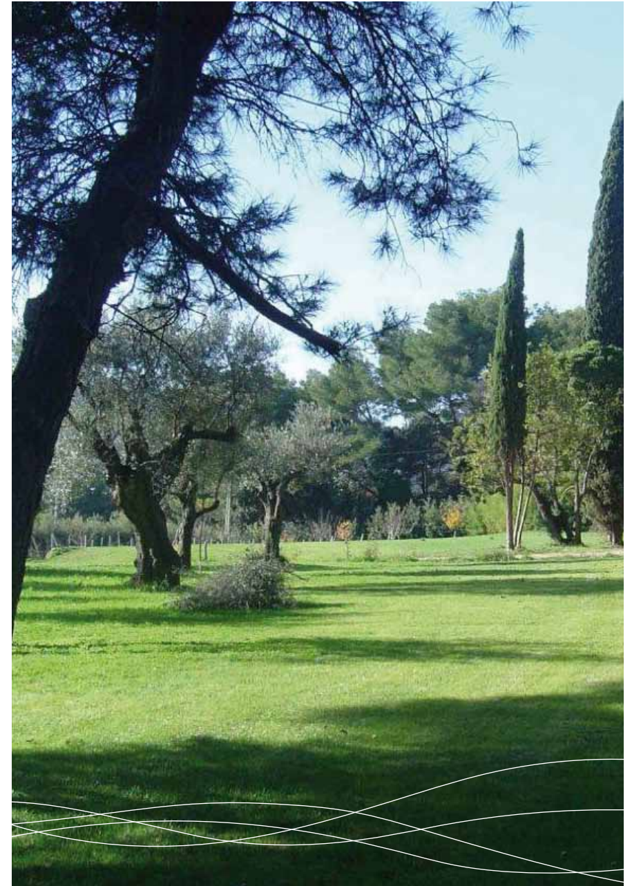
*Bâtiment Basse Consommation

A large swimming pool landscaped with vast terraces for enjoying the sun is at your disposal as well.